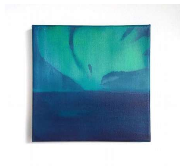
(sans titre) - 2019 Huile et acrylique sur toile 20 x 20 cm