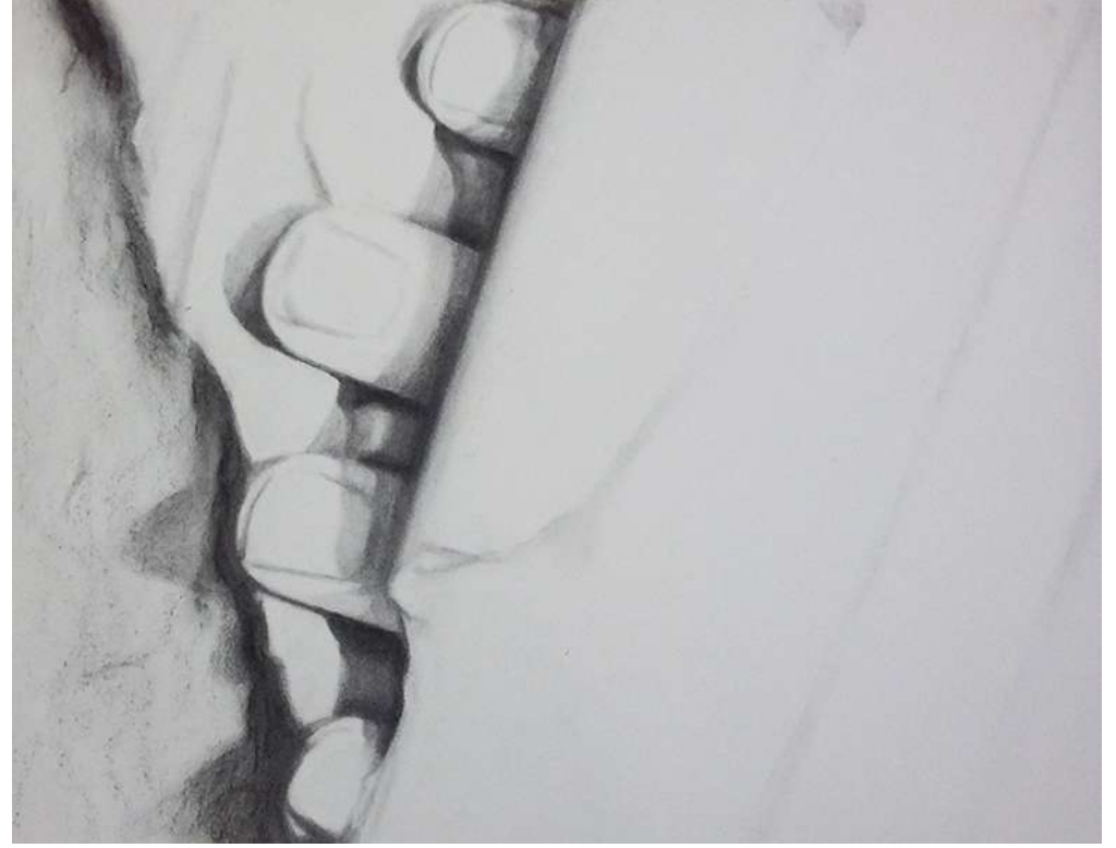
Les noces de Pirithoos - 2020