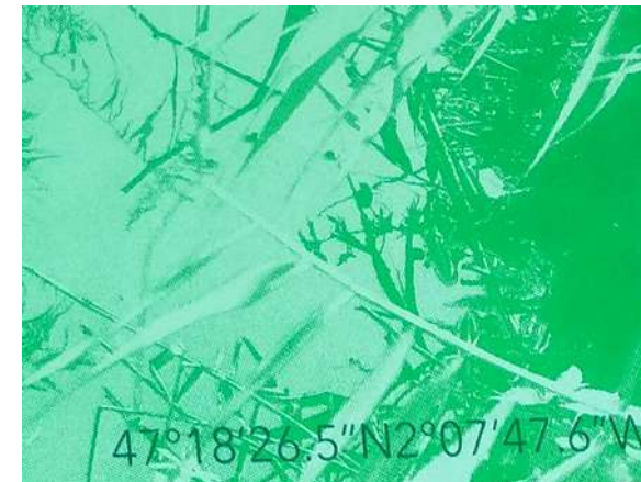
Les Fossés - 47°18'26.5"N2°07'47.6"W -2021 Sérigraphie (encres vertes, dégradés et peinture phosphorescente)

D'après une enquête photographique menée dans la zone du port méthanier de Montoire-de-Bretagne. Recherche de micro paysage dans les fossés. Ici un fossé géolocalisé aux abords de l'usine d'engrais chimique Norvégienne Yara en juin 2020, Usine classée SEVESO , l'une des plus polluantes de l'estuaire de la Loire.