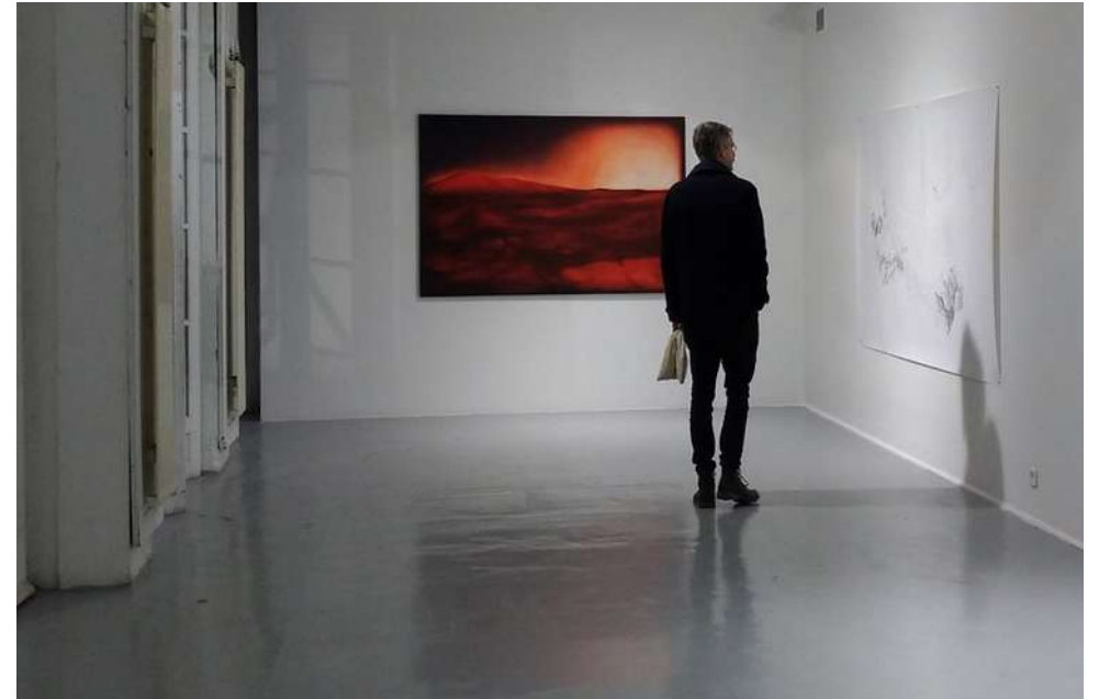
Teaser - 2019 Huile et acrylique sur toile 250 x 280 cm

Peinte d'après une photographie de coucher de soleil sur Mars transmise par Hubble, Teaser évoque, mais sans la reprendre une image apparaissant dans "Total Recall", le film de Paul Verhoeven sorti en 1990 et inspiré d'une nouvelle de Philip K. Dick. C'est une vision saturée, fantasmée, inspirée des phénomènes spatiaux qui sont recolorisés dans des laboratoires scientifiques