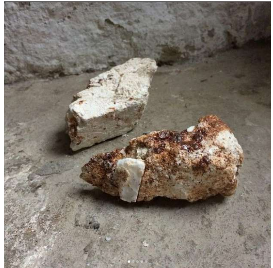
2021 Carottages du lit d'un fleuve fossile passé par le feu. Kaolin-quartz - micashistes - shistes rouges - silts